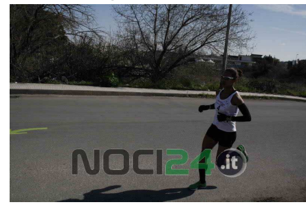
Lavori su via Moro